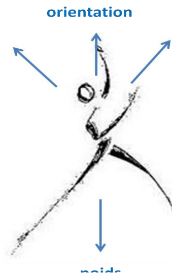
© Nicole Harbonnier, Catherine Ferri, La relation gravitaire en AFCMD, sur illustration Clip art, 2014.